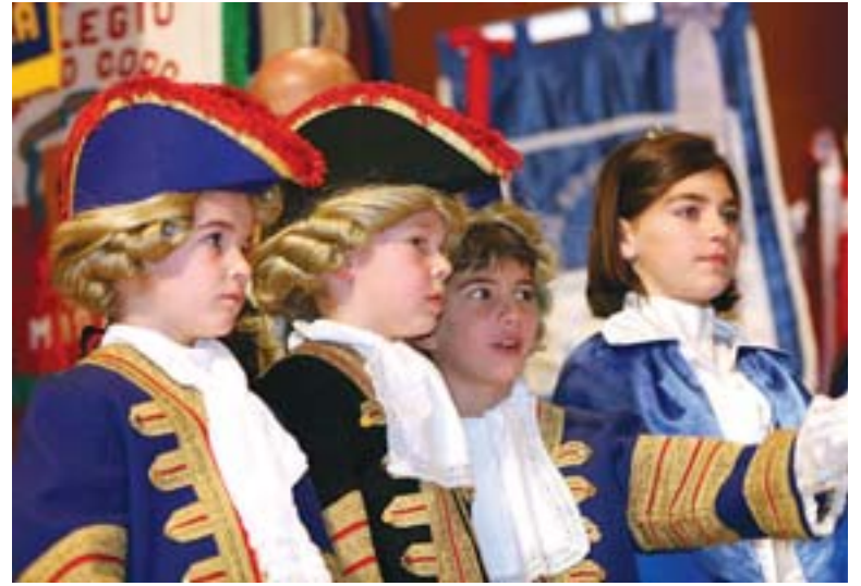
Hurrek ez zuten detailerik galdu.