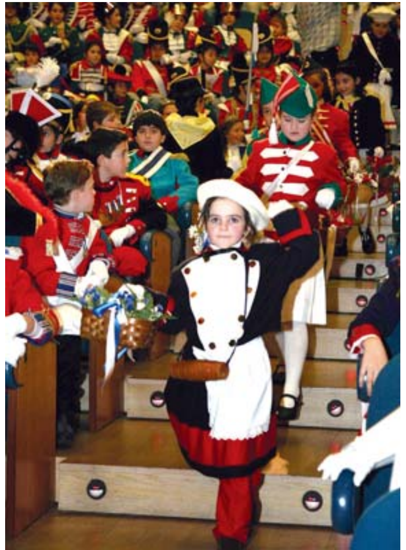
Kantinerak izan ziren protagonista ohorezko karguen aurkezpenen.