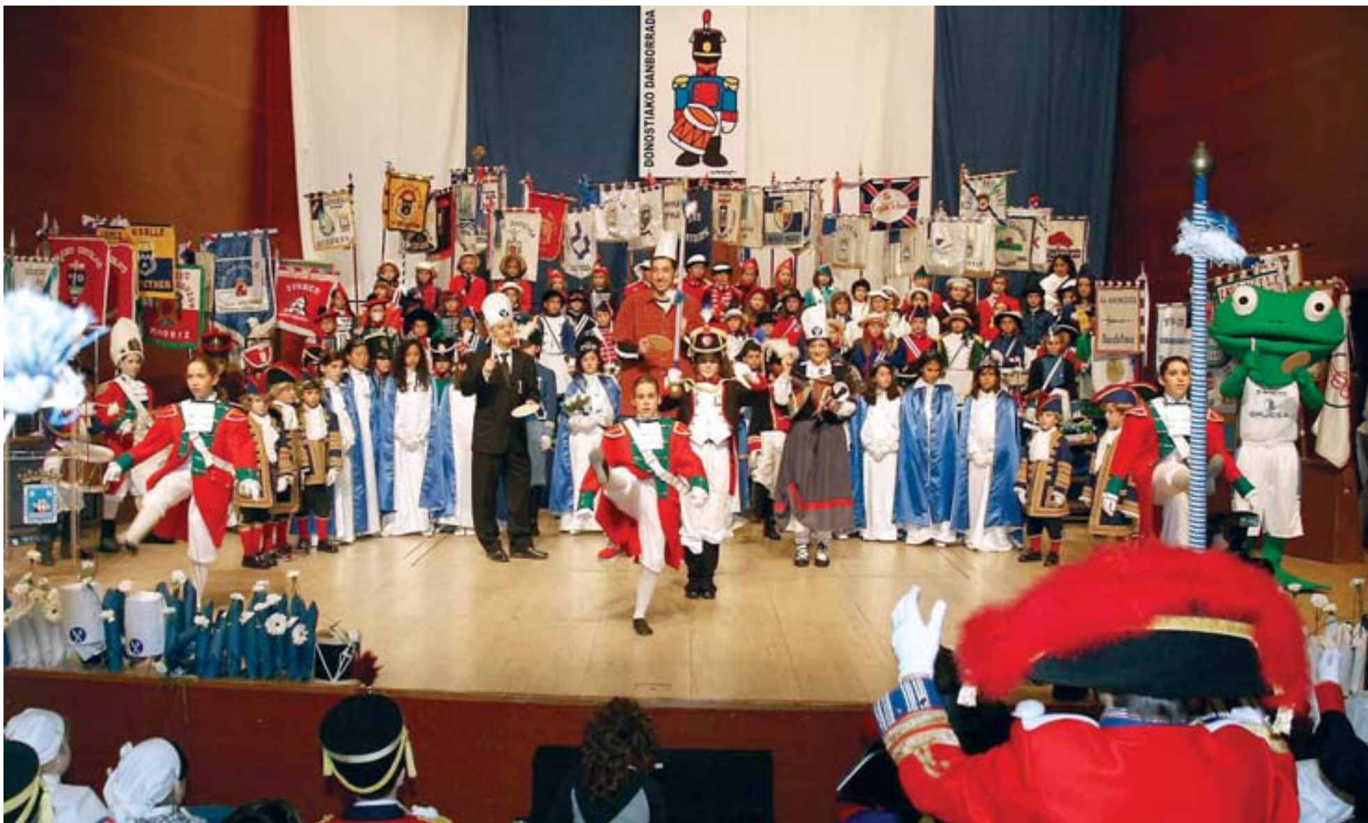
Protagonista guztiek 'San Sebastian martxa' jo zuten atzo Kursaaletan egindako ekitaldia amaitzeko.