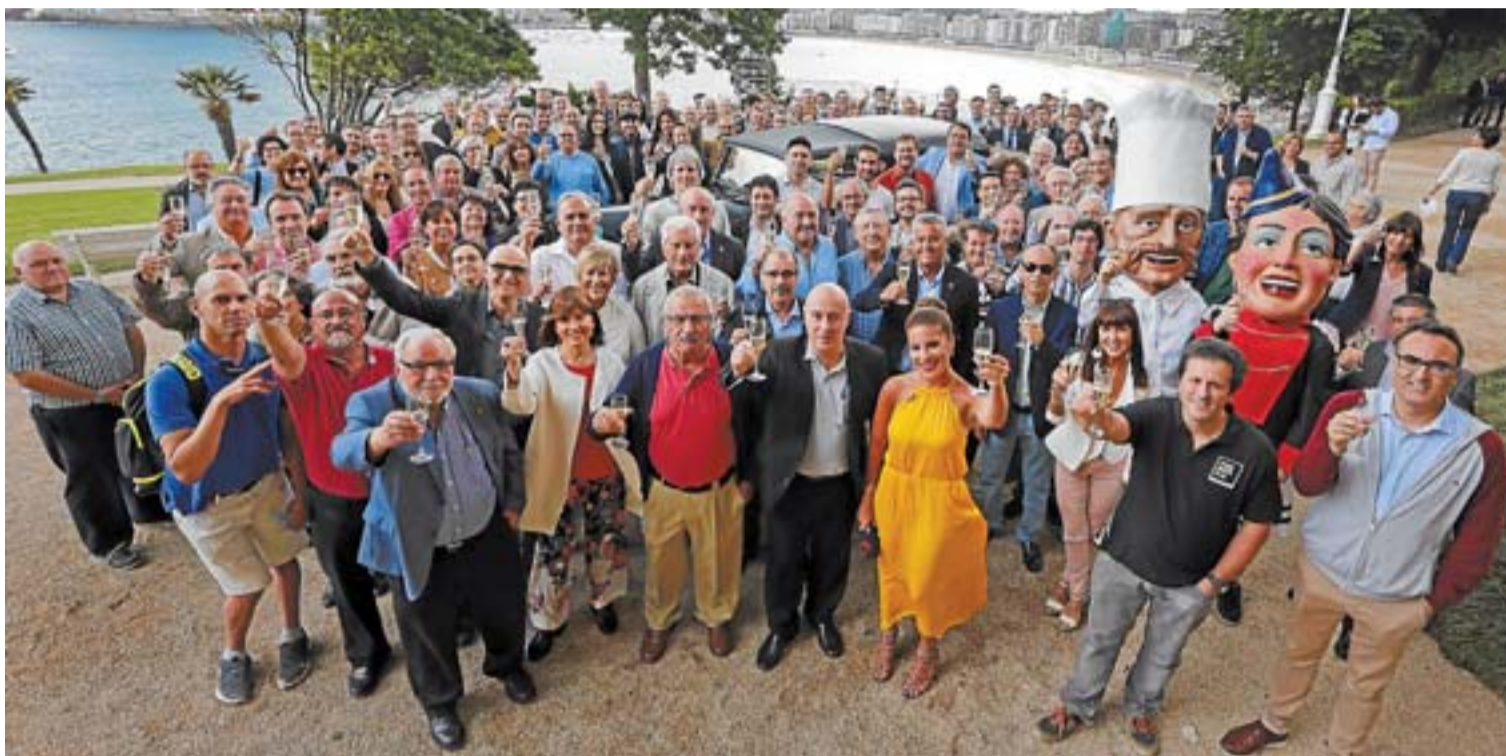
Cerca de cien invitados celebraron ayer el inicio del programa 'Contigo en la Playa', que se emitirá esta vez desde Miramar.

Hoy parece que el pícaro resucita o acaso nunca haya muerto. ¿Tal vez estafa o defrauda por comer todos los días? No. Estos nuevos pícaros de los despachos planean más altos vuelos y fijan sus ambiciones en coches más ostentosos, residencias más lujosas, ropas caras. La cosa varía bastante. No es lo mismo engañar al amo para aplacar las exigencias del estómago –como hacía el Lazarillo– que burlarse de la sociedad entera para vivir como un pachá.