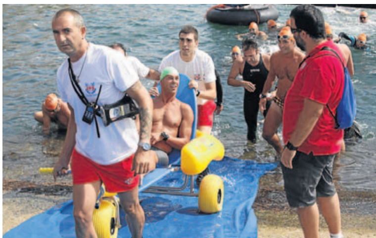
Miembro del equipo de natación adaptada, a su llegada a meta.