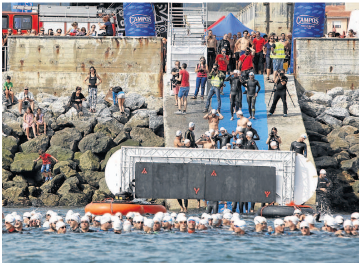
La carrera, que suma ya cuatro ediciones, registró 166 inscripciones más que el año pasado.